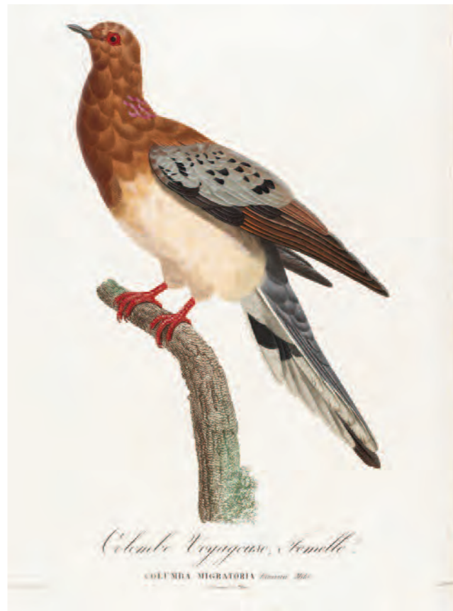
Vandringsduva, (hona från Knip, Le Pigeon ).

Det är med stor tacksamhet Universitetsbiblioteket med en utställning kan presentera denna betydelsefulla donation av en livslång samlargärning.