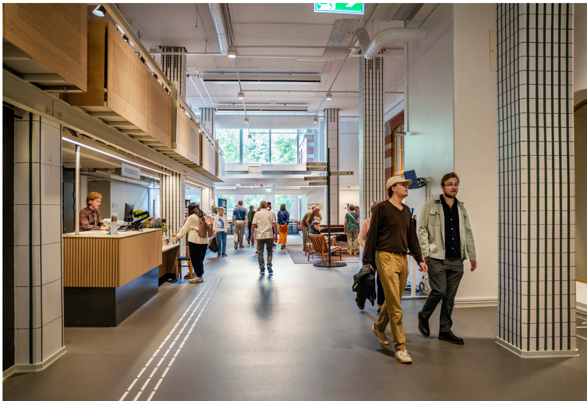
Bibliotekets entré efter renoveringen 2024–2025.