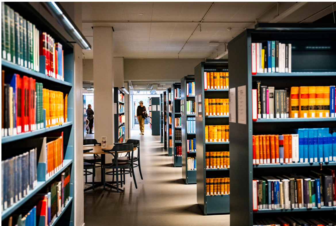
I den publika samlingen finns referenslitteratur och temasamlingar.