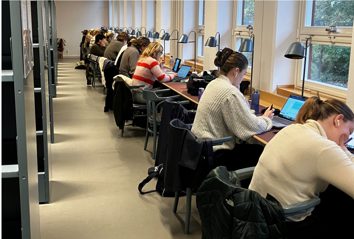
Nya studieplatser efter renoveringen 2024–2025.