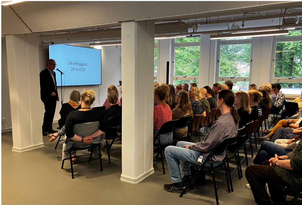
En ny miljö för samtal och diskussion har skapats i biblioteket.