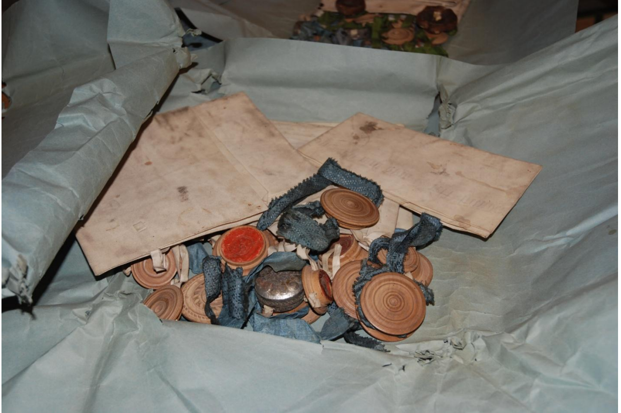
Tidigare förvaring av pergamentsbrev