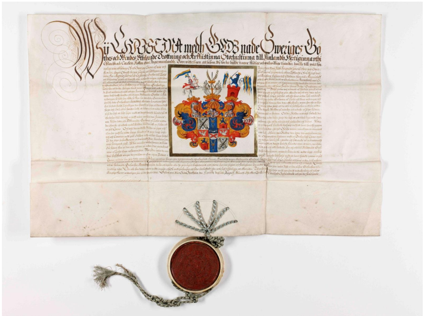
Vapenförbättringsbrev för Magnus Gabriel De la Gardie 1650-08-14