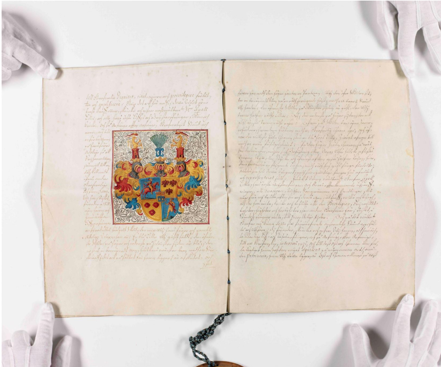
Grevebrev för Axel Gustafsson Lillie 1652-08-20