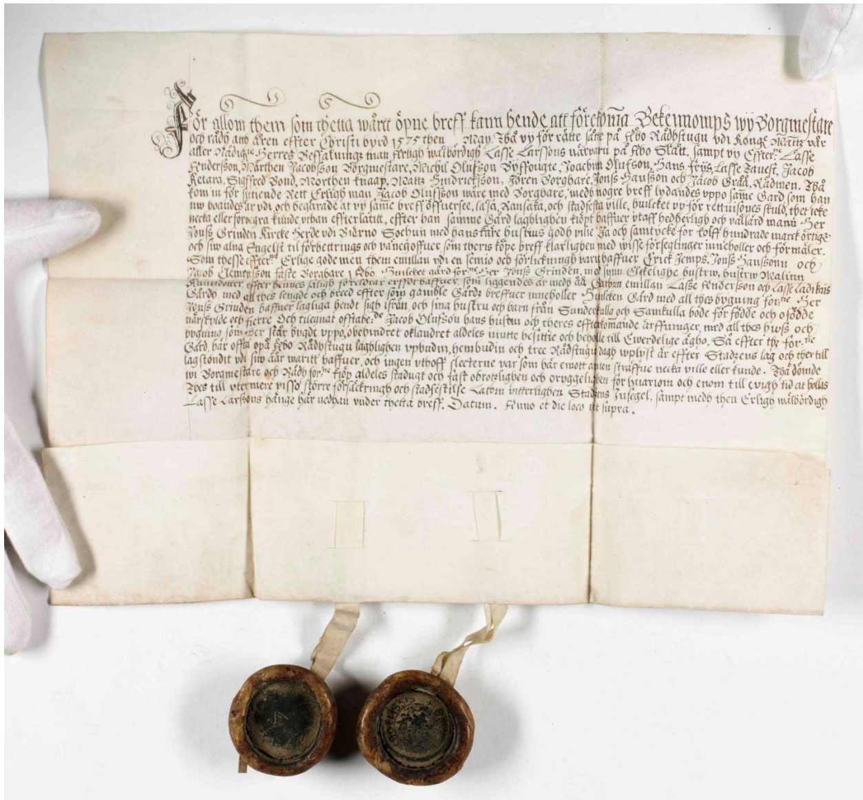
Fastebrev från Åbo 1575