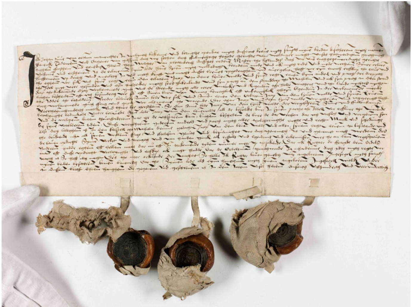
Fastebrev från Estland 1534