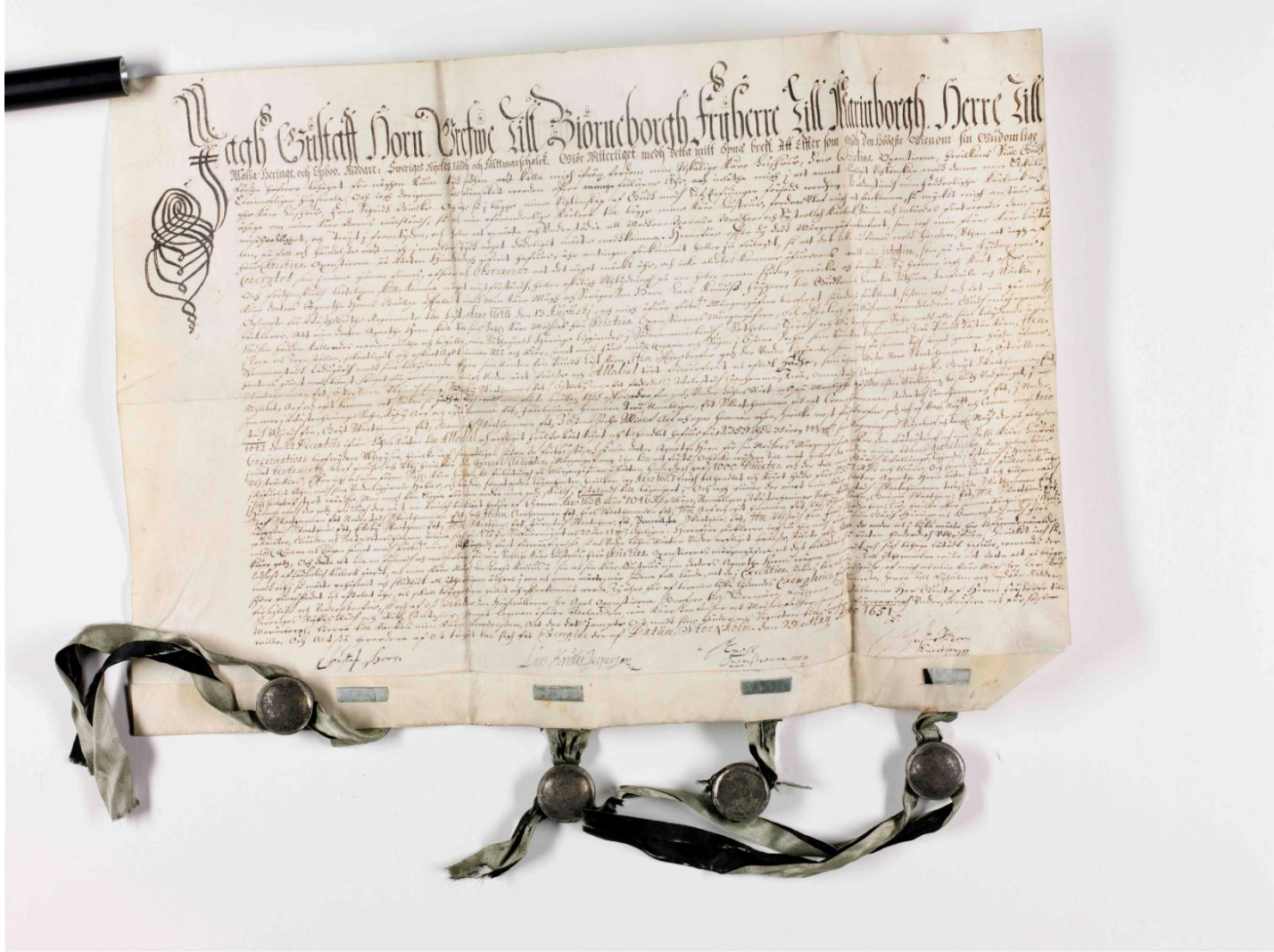
1651-05-29. Gustaf Horns förklaring till morgongåvobrevet.