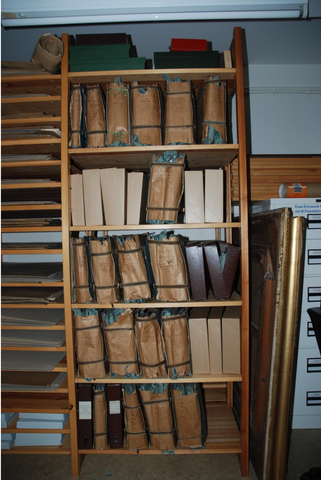
Tidigare förvaring av pergamentsbrev