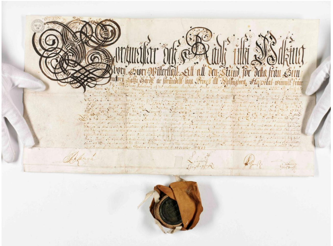
Fastebrev utfärdat av magistraten i Helsingborg 1687-10-26