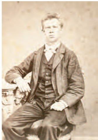
Carl Fredrik Hill som elev på Katedralskolan.

Korrespondensen fortsätter under paristiden. Hill är väl orienterad i konstarten, och ett viktigt brev berättar om "les intransigeants", dvs. de unga radikala målarna. Brevet dateras Montigny den 4 juni 1876, då impressionisterna – som de sedan ska kallas – just haft sin andra utställning på Rue Péletier. Någon direktkontakt är det inte fråga om. Hill går emellertid på en visning i Manets ateljé för att se två målningar som refuserats av Salongsjuryn. Han summerar: "Jag har gått dit. En präktig ateljé och 2 talentfulla taflor."