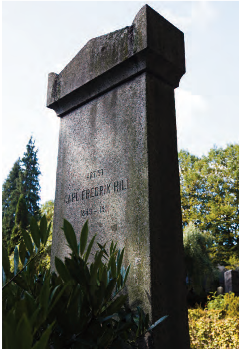
Carl Fredrik Hills gravsten, Östra kyrkogården.