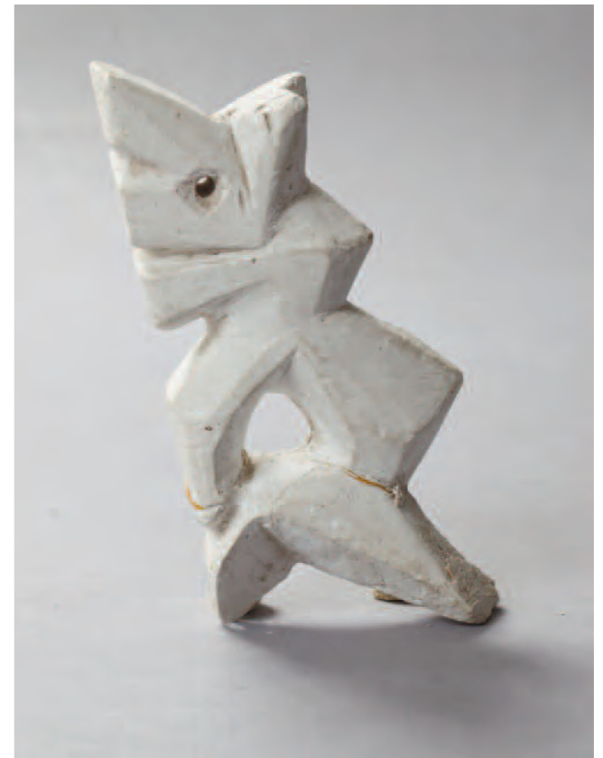
Modell utförd av Arne Jones.

Det är en vandring som gjorts av många lundensare.