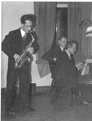
Sigurd M. Rascher - den förste internationellt kände saxofonisten i konstmusikaliska sammanhang. Rascher var av tysk härkomst. Han lämnade Tyskland 1933 och blev lärare vid musikkonservatorierna i Köpenhamn och Malmö 1933-1936. Det var till honom som Lars-Erik Larsson skrev sin välbekanta saxofonkonsert. I slutet av 1930-talet flyttade Rascher för gott till USA.